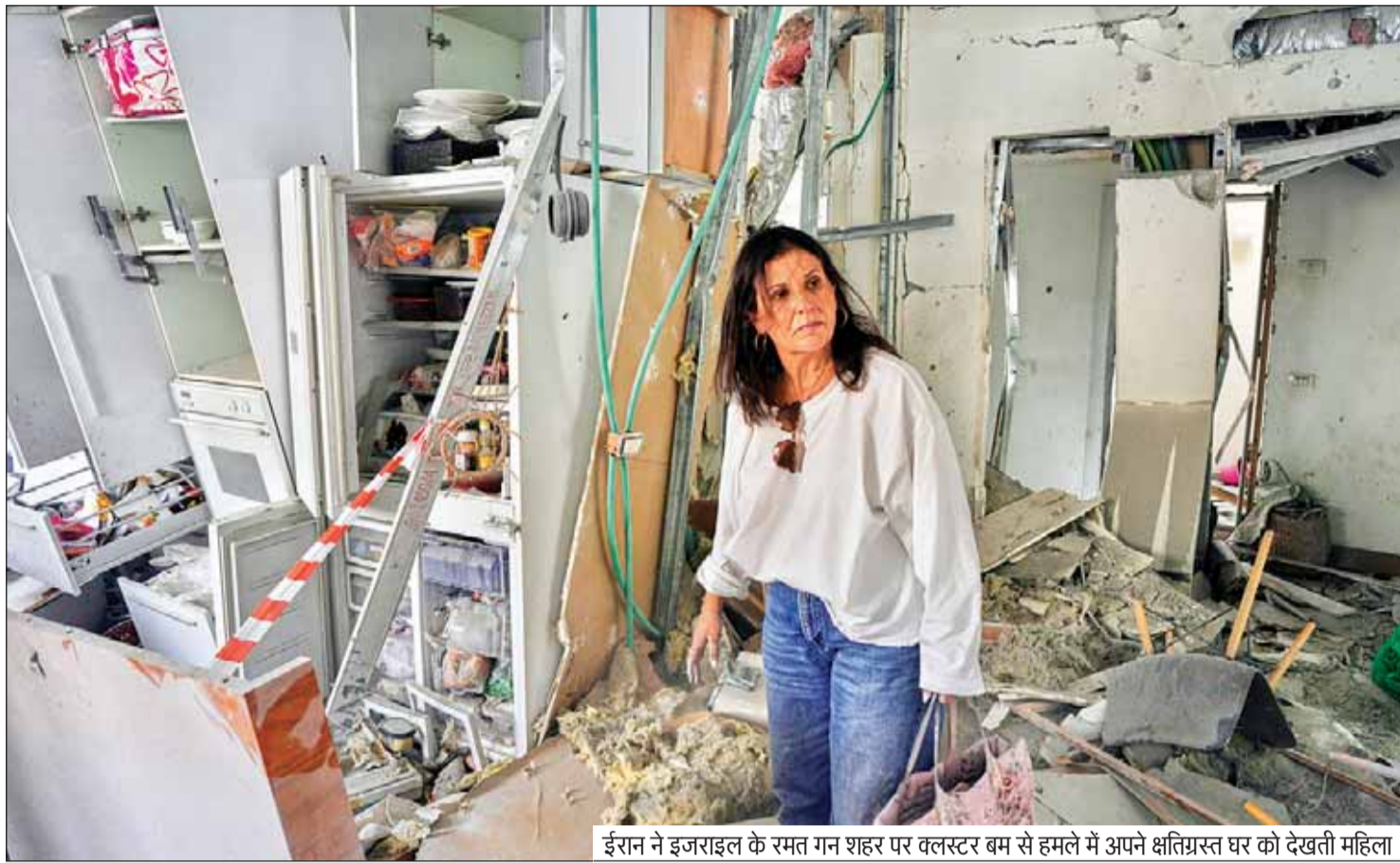
ईरान ने इजराइल के रमत गन शहर पर क्लस्टर बम से हमले में अपने क्षतिग्रस्त घर को देखती महिला

ईरान ने दावा किया है कि 28 फरवरी से जारी हमलों में देश के शिक्षा क्षेत्र को भारी नुकसान हुआ है। ईरान के विदेश मंत्रालय के अनुसार, अमेरिका और इजराइल के हमलों में अब तक 600 से ज्यादा स्कूल और शैक्षणिक संस्थान प्रभावित हुए हैं। इन हमलों से स्कूलों की इमारतें नष्ट या क्षतिग्रस्त हुई हैं, जिससे बच्चों की पढ़ाई पर गंभीर असर पड़ा है। साथ ही कई जगह छात्रों और शिक्षकों के हताहत होने की भी खबरें सामने आई हैं। इस घटनाक्रम के बाद ईरान ने अंतरराष्ट्रीय समुदाय से इस मुद्दे पर ध्यान देने और कार्रवाई करने की मांग की है। वहीं, लगातार जारी हमलों के कारण देश में शिक्षा व्यवस्था भी बुरी तरह प्रभावित हो रही है।