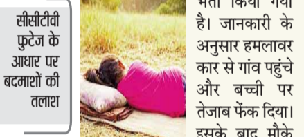
सीसीटीवी फुटेज के आधार पर बदमाशों की तलाश

जिले के खाडोली गांव में एक दिल दहला देने वाली घटना सामने आई है। यहां 11 साल की बच्ची पर बदमाशों ने तेजाब फेंक दिया। जिससे वह बुरी तरह घायल हो गई है। उसे जिला अस्पताल के बर्न वार्ड में भर्ती किया गया है। जानकारी के अनुसार हमलावर कार से गांव पहुंचे और बच्ची पर तेजाब फेंक दिया। इसके बाद मौके से फरार हो गए हैं। हमले में बच्ची गंभीर रूप से झुलस गई। घटना के बाद परिजन ने बच्ची को तुरंत जिला अस्पताल में भर्ती कराया, जहां बर्न वार्ड में उसका इलाज जारी है। डॉक्टरों के अनुसार फिलहाल बच्ची की हालत स्थिर बनी हुई है। मामले की सूचना मिलते ही पुलिस मौके पर पहुंची और अज्ञात आरोपियों के खिलाफ एफआईआर दर्ज कर जांच शुरू कर दी है। पुलिस आसपास के सीसीटीवी फुटेज और अन्य साक्ष्यों के आधार पर आरोपियों की तलाश कर रही है।