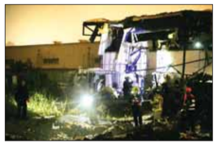
ईरानी रिवाल्यूशनरी गार्ड्स कॉर्प्स (आईआरजीसी) ने दावा किया है कि उसने तेल अवीव और एरलात में इजराइली सेना और सैन्य औद्योगिक कंपनियों पर ताजा हमले करके भारी

नुकसान पहुंचाया है। आईआरजीसी ने कहा कि इन हवाई हमलों में इजराइली ठिकानों और उपकरणों को नष्ट किया गया। इजराइल की तरफ से अब तक इस दावे की आधिकारिक पुष्टि नहीं हुई है, लेकिन इलाके में सुरक्षा अलर्ट और एंटी-मिसाइल सिस्टम सक्रिय हैं।