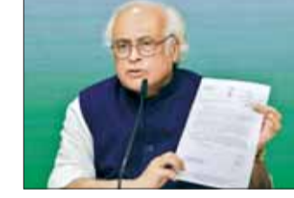
नई दिल्ली

कांग्रेस ने एक बार फिर से मोदी सरकार पर निशाना साधा है। लोकसभा और राज्यसभा का तीन दिवसीय विशेष सत्र 16 से 18 अप्रैल तक बुलाया गया है। इसपर कांग्रेस ने आपत्ति जताई है। कांग्रेस के सांसद जयराम रमेश ने कहा कि 16 मार्च को संसदीय कार्य मंत्री किरण रिजिजू ने राज्यसभा में विपक्ष के नेता और कांग्रेस अध्यक्ष मल्लिकार्जुन खरगे को पत्र लिखा था। इसमें उन्होंने कांग्रेस के साथ चर्चा करने की इच्छा व्यक्त की थी। जयराम ने कहा कि सरकार महिला आरक्षण विधेयक, 2023 में कुछ संशोधन करना चाहती है। जयराम ने बताया किरेन रिजिजू का पत्र 16 मार्च को हमें मिला और खरगे ने उसी दिन जवाब देते हुए कहा था मुझे आपका पत्र प्राप्त हुआ है, लेकिन कृपया सर्वदलीय बैठक बुलाएं। हम इस पर चर्चा करेंगे।