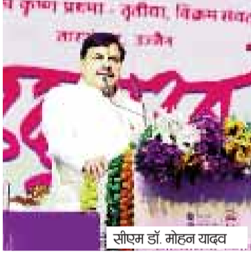
हरिभूमि न्यूज ॥ भोपाल

सीएम डॉ. यादव ने कहा- उज्जैन को साइंस सिटी के रूप में भी स्थापित किया जा रहा