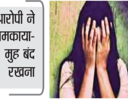
हरिभूमि न्यूज ॥ राजगढ़

जिले के जीरापुर थाना क्षेत्र में महिला के साथ दुष्कर्म का मामला सामने आया है। पीड़िता की शिकायत के बाद पुलिस ने कार्रवाई करते हुए आरोपी को गिरफ्तार कर