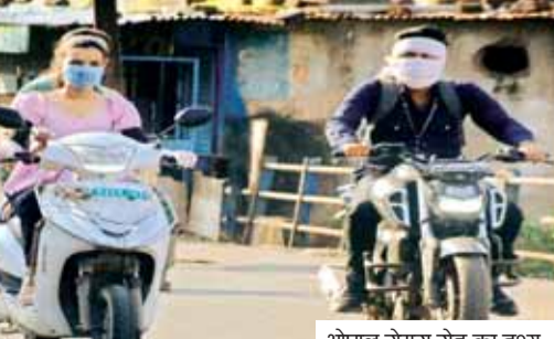
भोपाल सेमरा रोड का दृश्य

तीन से चार डिग्री गिरा दिन और रात का तापमान ग्रामीण क्षेत्रों में ओले गिरने से फसलों को नुकसान