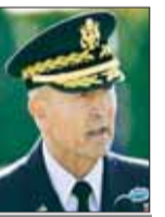
अब काश पटेल-तुलसी गबाई की भी बारी

अर्मी चीफ और अर्मी जनरल को हटाया वॉशिंगटन। अमेरिका के राष्ट्रपति डोनाल्ड ट्रंप ने एक ही रात में अपनी सेना और सरकार के बड़े अधिकारियों को हटाकर पूरी दुनिया को चौंका दिया है। ट्रंप प्रशासन ने अर्मी चीफ जनरल रैंडी जॉर्ज को पद से हटाकर उन्हें तुरंत रिटायर होने का आदेश दे दिया है। अब ट्रंप सरकार में कुछ और बड़े अफसरों को निकाले जाने की आशंका बढ़ गई है। अमेरिकी वेबसाइट द अटलांटिक की रिपोर्ट के मुताबिक अगला नंबर एफबीआई चीफ काश पटेल और नेशनल