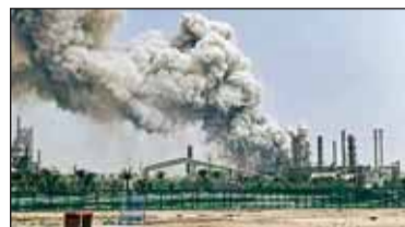
ईरान ने मिडिल ईस्ट में जंग का रुख बदल दिया है। उसने कुवैत के पानी प्लांट और अबु धाबी के गैस प्लांट पर हमलों से खाड़ी देशों में हड़कंप मच गया है। कुवैत के मीना अल-अहमदी पोर्ट पर बनी ऑयल रिफाइनरी पर दो हमलों में तीसरी बार

हमला हुआ है। यह मिडिल ईस्ट की सबसे बड़ी रिफाइनरी में से एक है। कुवैत और ईरान की दूरी सिर्फ 80 किमी दूर है। वहीं, ईरान ने अबु धाबी में हबशन गैस फैसिलिटी के पास एयर डिफेंस सिस्टम द्वारा एक हमले को इंटरसेप्ट किया गया, लेकिन इसके बाद गिरे मलबे से आग लग गई। स्थानीय प्रशासन ने तुरंत कार्रवाई करते हुए प्लांट का संचालन अस्थायी रूप से बंद कर दिया। राहत की बात यह रही कि इस घटना में किसी के हताहत होने की सूचना नहीं है।