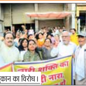
शराब दुकान का विरोध।