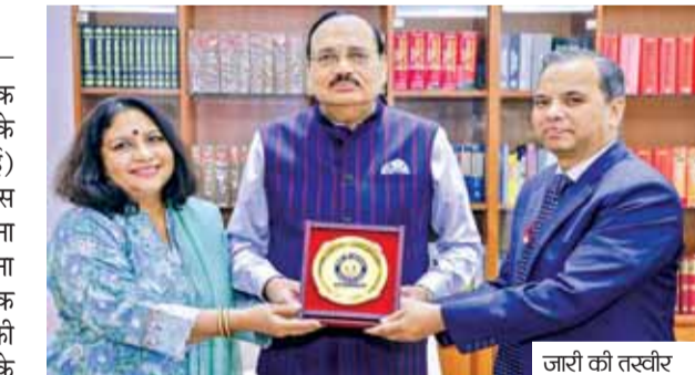
जारी की तस्वीर

गृह मंत्रालय (एमचए) के एक अधिकारी ने बताया कि भारत के मुख्य न्यायाधीश (सीजेआई) सुर्यकांत ने शुक्रवार को अपने आवास पर जनगणना 2027 की स्व-गणना प्रक्रिया में भाग लिया। जनगणना 2027 ने सोशल मीडिया पर एक संदेश जारी कर इस बात की पुष्टि की और नागरिकों को स्व-गणना करने के लिए प्रोत्साहित किया। जनगणना आयुक्त कार्यालय ने कहा कि भारत के मुख्य न्यायाधीश ने अपने आवास पर संस 2027 के प्रथम चरण यानी गृह सूचीकरण और आवास जनगणना की स्व-गणना सफलतापूर्वक पूरी कर