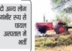
दो अन्य लोग गंभीर रूप से घायल अस्पताल में गती