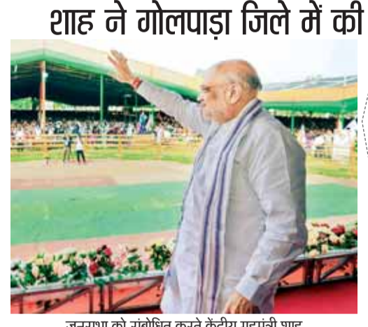
जनसभा को संबोधित करते केंद्रीय गृहमंत्री शाह

शाह ने गोलपाड़ा जिले में की चुनावी रैली जनजातीय विकास के लिए रोडमैप तैयार