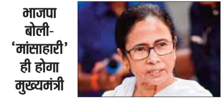
भाजपा बोली- 'मांसाहारी' ही होगा मुख्यमंत्री

ममता की नॉन-वेज पॉलिटिक्स ने भाजपा को डाला घोर असमंजस में